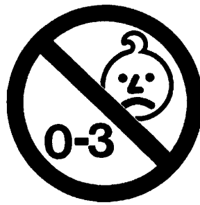
Figura 1. Símbolo de advertencia sobre la edad.

El diseño del símbolo debe ser el indicado en la figura 1.